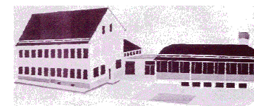
OSNOVNA ŠOLA LJUBNO OB SAVINJI